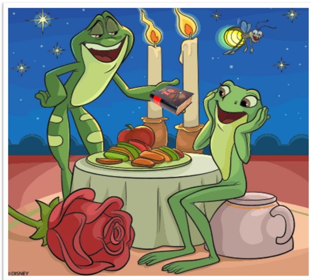
8.1. Na górze róże, na dole fiołki, bardzo cię kocham, więc dam ci książki.